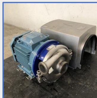
ALFA LAVAL 5,5 KW Centrifuge inox S/S centrifuge pump