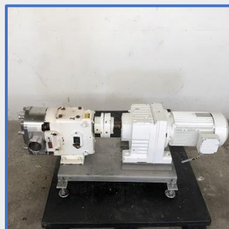
WAUKESHA Cherry-Burrell A lobes – Modèle 130U2 S/S rotary lobe pump