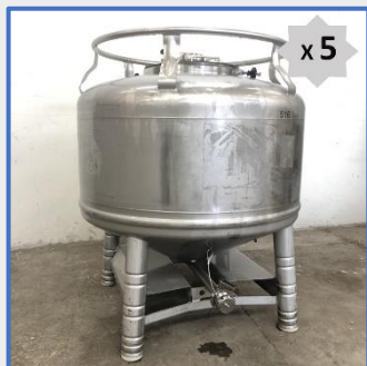
500 LITRES – THYSSEN