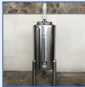
600 LITRES- VATRON MAU Agitée, inox S/S – Agitated tank