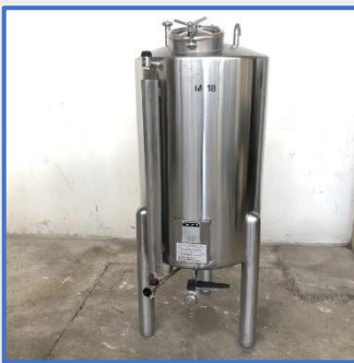
280 LITRES – VATRON MAU Inox Stainless steel