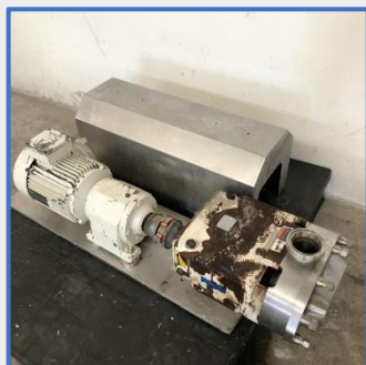
WAUKESHA Cherry-Burrell A lobes - Modèle 060U2 S/S rotary lobe pump