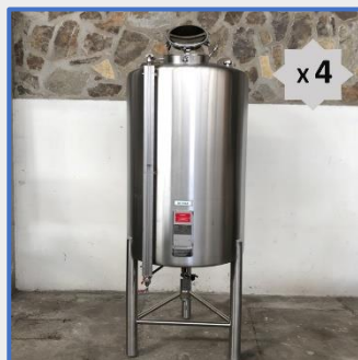
1700 LITRES – 3C Inox Stainless steel