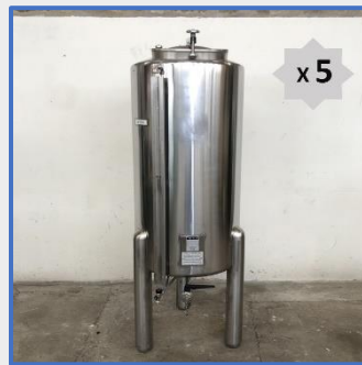
600 LITRES – VATRON MAU Inox Stainless steel