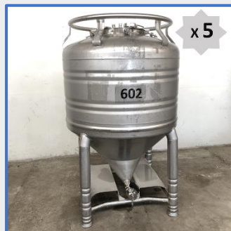
600 LITRES – GALLAY