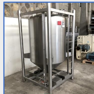
2000 litres – 3C