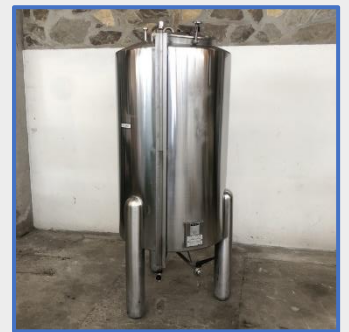
1200 LITRES - VATRON MAU Inox Stainless steel