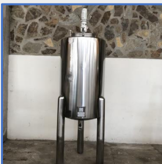
1200 LITRES – VATRON MAU Agitée, inox S/S – Agitated tank